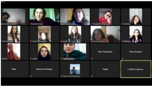
ՀՀ պատմության և բնության հուշարձաններ, բանահավաքություն/2օր/